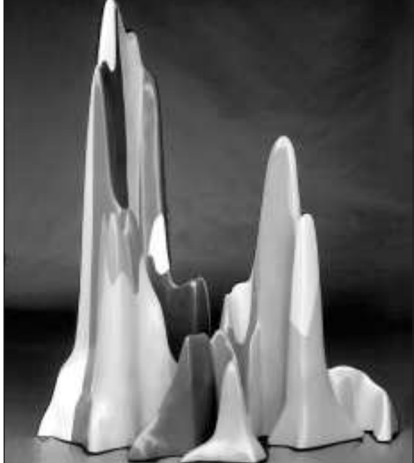
«Splotches», scultura di Sol LeWitt in mostra alla galleria Minini

In mostra Splotches , sculture del famoso artista americano