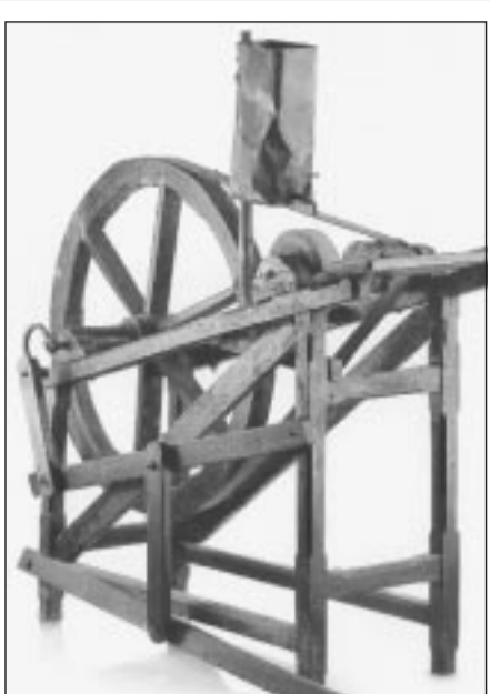
A destra: lo spresòr (tavolo, fascera e secchio) utilizzato per la produzione del formaggio, e una mola (mola per ferri da legno). Sotto: una pagina del libro «La memoria delle cose» con una serie di stampi per il burro