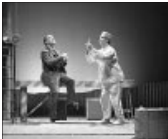
«Extracom», lo spettacolo (e libro) che apre la serie

BRESCIA - Via Lattanzio Gambarà, 55 Tel. 030.37401 - Fax 030.3772300