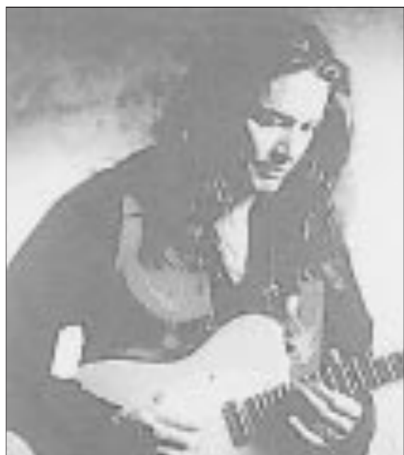
Il chitarrista Robben Ford chiuderà il festival il 24 luglio